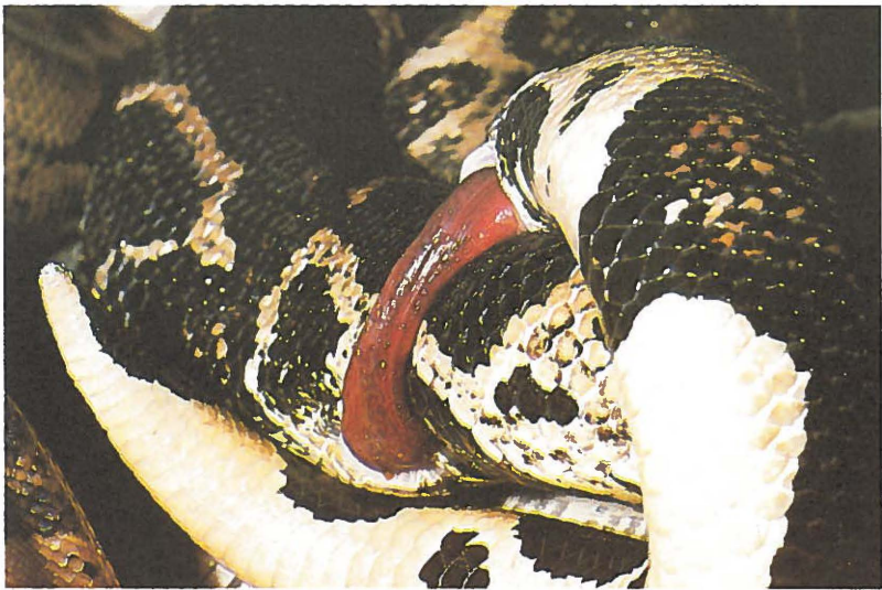
Fig. 2. Boa constrictor ortonii in copula.